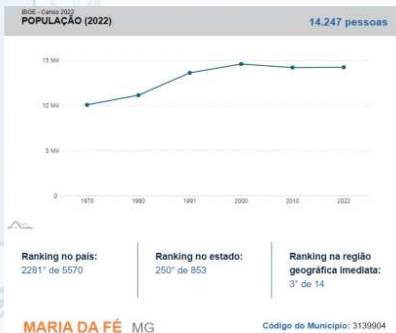
Figura 02– Dados oficiais de Maria da Fé https://cidades.ibge.gov.br/panorama-impresso?cod=3139904

Conforme os dados do Censo de 2022, a população total de Maria da Fé é de 14.247 habitantes, sendo 8.383 habitantes residentes na área urbana e 5.864 habitantes na área rural. A densidade demográfica 70,06 hab./ km 2 .