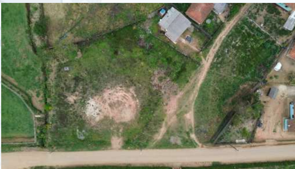
Foto 01 – Local da Instalação da UBS TIPO I em no Bairro Mata de Baixo em Maria da Fé

Assim o presente estudo preliminar tem como propósito assegurar a viabilidade técnica da eventual e futura contratação de empresa especializada para execução de obra de engenharia para construção de unidade básica de saúde (UBS TIPO I) através da liberação de recursos do Programa de Aceleração do Crescimento (PAC), proposta SISMOB 11923.5670001/25-004, programa 3600020250002 - Novo PAC - Unidades Básicas de Saúde, Proposta do Transfere.gov 36000008996/2025 , para fomentar a estruturação dos sistemas locais de saúde e a garantia de um atendimento de saúde universal, equitativo e integral, a fim de fortalecer a prevenção, promoção e recuperação da saúde, atuando de maneira direta e indireta no processo saúde/doença da população local.