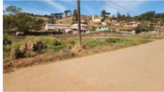
Foto 02 e 03 – Local da Instalação da UBS TIPO I em no Bairro Mata de Baixo em Maria da Fé