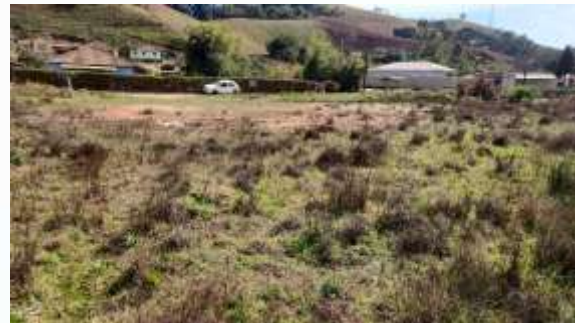
Foto 04 e 05 – Local da Instalação da UBS TIPO I em no Bairro Mata de Baixo em Maria da Fé

A Lei 14.133/2021 em seu art. 6º, inciso XXV, determina que o Projeto Básico, conjunto de elementos necessários e suficientes, com nível de precisão adequado para definir e dimensionar a obra ou o serviço, ou o complexo de obras ou de serviços objeto da licitação, elaborado com base nas indicações dos estudos técnicos preliminares, que assegure a viabilidade técnica e o adequado tratamento do impacto ambiental do empreendimento e que possibilite a avaliação do custo da obra e a definição dos métodos e do prazo de execução.