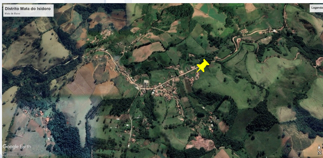
Foto 04 – Foto Aérea do local da instalação da UBS, Distrito Mata do Isidoro.

Os serviços serão acompanhados pelo Departamento de Engenharia da Secretaria Municipal de Planejamento, fiscalizadora do contrato, sendo que as medições de cada etapa serão liberadas para pagamento somente após ateste da mesma pela Secretaria requisitante e pelo Chefe do Poder Executivo, podendo ser realizado durante a semana inteira, conforme disponibilidade de materiais e mão de obra, respeitadas as normas impostas pelas legislações trabalhistas vigentes;