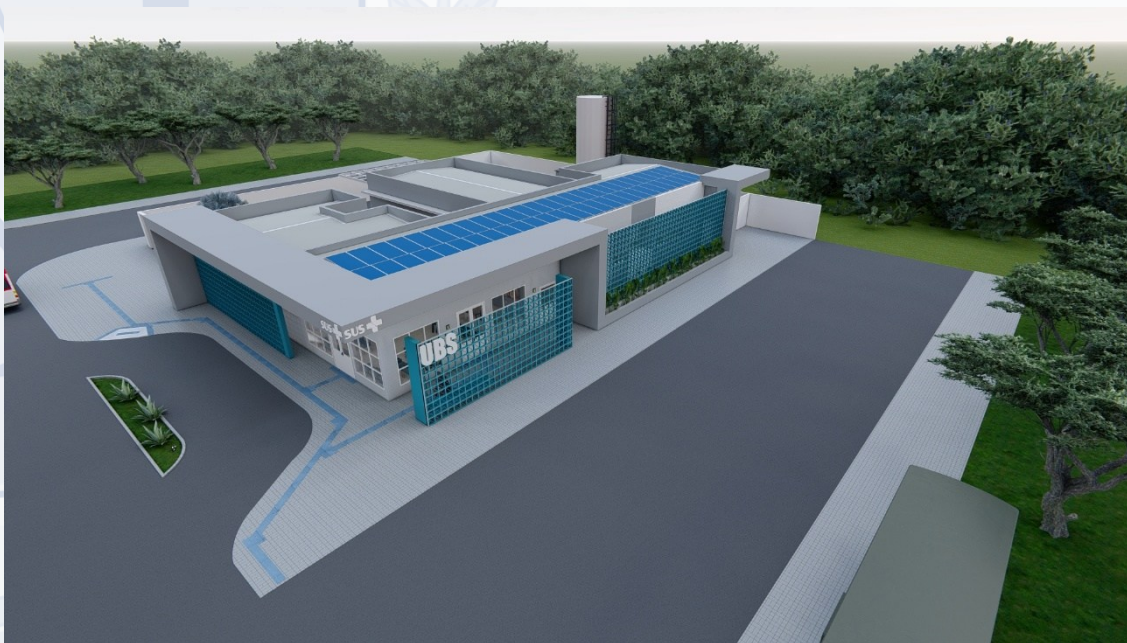
Figura 01 – Layout do projeto a ser executado pela empresa contratada.

Este Termo de Referência tem por objetivo estabelecer uma descrição detalhada e as diretrizes básicas que deverão ser seguidas para a contratação de empresa especializada para elaboração de projeto completo de engenharia e arquitetura destinado a construção da UBS tipo I, conforme proposta nº 11923.5670001/25-001, Novo Pac, conforme documentos anexos a este termo, através da liberação de recursos do Programa de Aceleração do Crescimento (PAC), proposta SISMOB 11923.5670001/25-001, programa 3600020250002 - Novo PAC - Unidades Básicas de Saúde, Proposta do Transfere.gov 36000008996/2025, para fomentar a estruturação dos sistemas locais de saúde e a garantia de um atendimento de saúde universal, equitativo e integral, a fim de fortalecer a prevenção, promoção e recuperação da saúde, atuando de maneira direta e indireta no processo saúde/doença da população local.