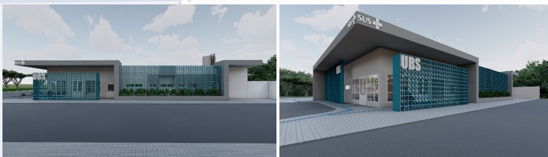
Figura 02 e 03 – Layout do projeto a ser executada pela empresa contratada.

favoreça a integração de soluções digitais, como a tele saúde, permitirá uma resposta mais ágil e eficaz às demandas de saúde, conectando de forma mais eficiente os diferentes níveis de atenção dentro da rede de saúde do município. Este investimento não apenas atenderá às necessidades imediatas da população de Maria da Fé - MG, mas também contribuirá para o desenvolvimento comunitário e a melhoria contínua da qualidade de vida da população, considerando fatores ambientais, de mobilidade urbana e acessibilidade.